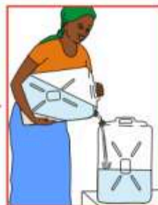
Transvasez l'eau claire dans un autre bidon et versez loin l'eau sale