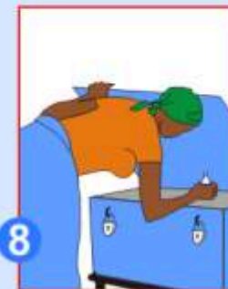
8 Conservez hors de portée des enfants et à l'abri du soleil