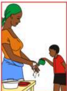
Avant de préparer la nourriture