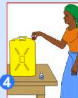
4 Fermez convenablement le bidon