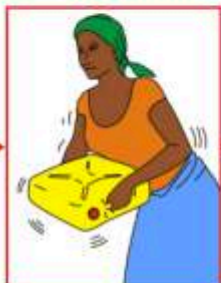
Agitez fortement le bidon