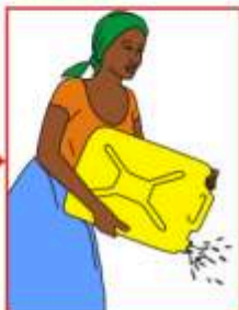
Versez loin cette eau et les grains