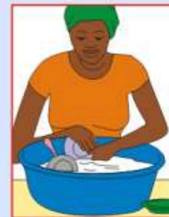
L'eau pour laver les ustensiles