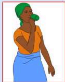
L'eau à boire