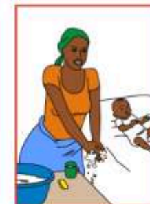
Après avoir touché les saletés du bébé