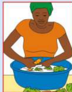
L'eau pour laver les aliments mangés crus