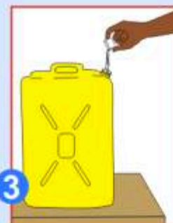
3 Versez cette dose dans l'eau du bidon de 20L