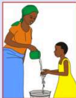
Eau pour se laver les mains