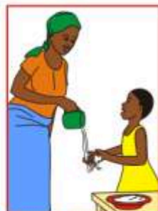
Avant de manger