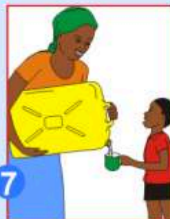
7 Utilisez un gobelet propre pour boire cette eau