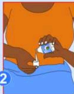
2 Mesurer la dose du produit à l'aide de son bouchon