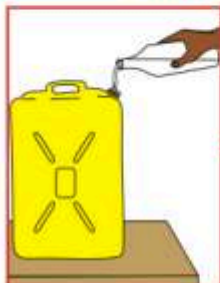
Mettez 2L d'eau dans un bidon