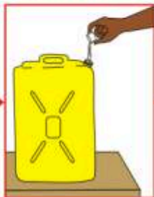
Mettez 2 bouchons de Sûr'Eau et des grains de maïs ou d'autres grains qui peuvent nettoyer l'intérieur du bidon