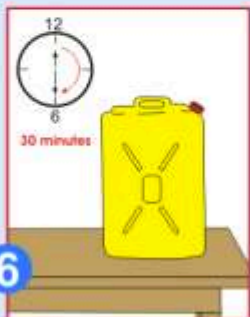
6 Attendez 30 minutes avant d'utiliser cette eau