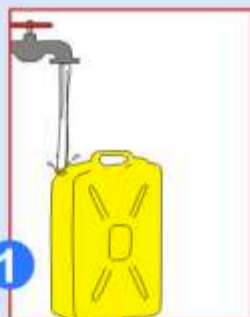
1 Puissez l'eau avec un bidon propre de 20L qui se ferme