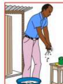
A la sortie des latrines