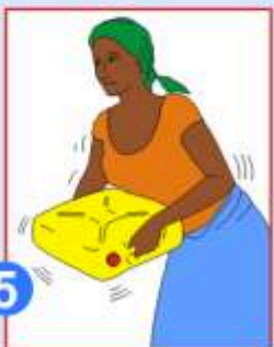
5 Agitez pour bien mélanger